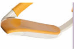
GKB-00.01 PVC Bezug der Fußplatten (Paar)