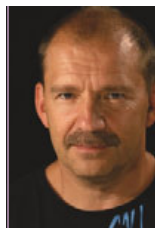
Designed by Jiří Španihel