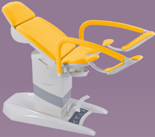
GKB-AX Elektromotorisch verstellbare Fußstützen (Paar)