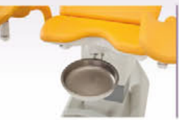
GKB-079 Sekretschale groß