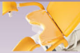
GKB-063 PVC – Bezug des Sitzteiles