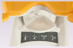
GKB-77 PVC Auffangfolie (unter dem Sitzteil angebracht)