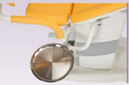
GKB-055 Drehbare Instrumentenplatte (R) GKB-065 Drehbare Instrumentenplatte (L)