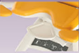
GKB-054 Instrumentenschale flach