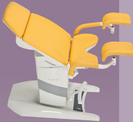
GKB-BX Elektromotorisch verstellbare Beinhalter nach Göpel (Paar)