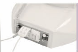
GKB-044 Steckdosen (EU)